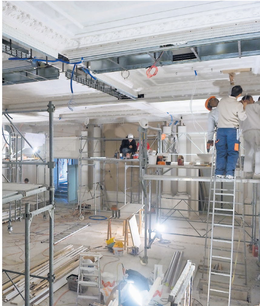
ein Prestigeobjekt unter der Aufsicht der Denkmalpflege: Das Zürcher Nobelhotel «Baur au Lac» engagierte die Gipsfirma Russo aus Andelfingen.

«Einst waren die Gipser Respektspersonen. Mit den ersten Verputzmaschinen und Akkordverträgen haben aber das Wissen und die Sorgfalt im Metier gelitten, und damit unser Ruf.» Die Andelfinger Firma reagiert, indem sie ihre Angestellten selber auf das gewünschte Niveau ausbildet. Weitere Fachkräfte rekrutiert sie unter anderem in Italien. «Bei uns lernt jeder gratis Italienisch, denn die Italiener lernen selten richtig Deutsch», lacht er. Sogar ihm als Secondo ging es so. Er sprach zu Hause vor allem die «Muttersprache» Deutsch und lernte erst in der Firma die «Vatersprache» Italienisch richtig. (sm)